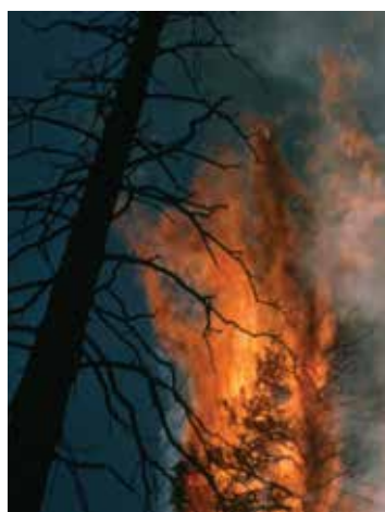
NPS / SELLERS

野火可能在您游览黄石公园的过程中出现。持续的野火可能散发出烟雾，并且不断变化。这些变化可能会影响到您的观光计划。