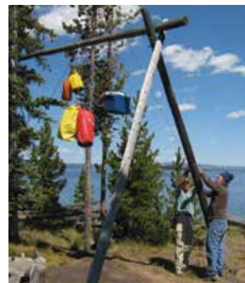
在野外露营地保持食品安全