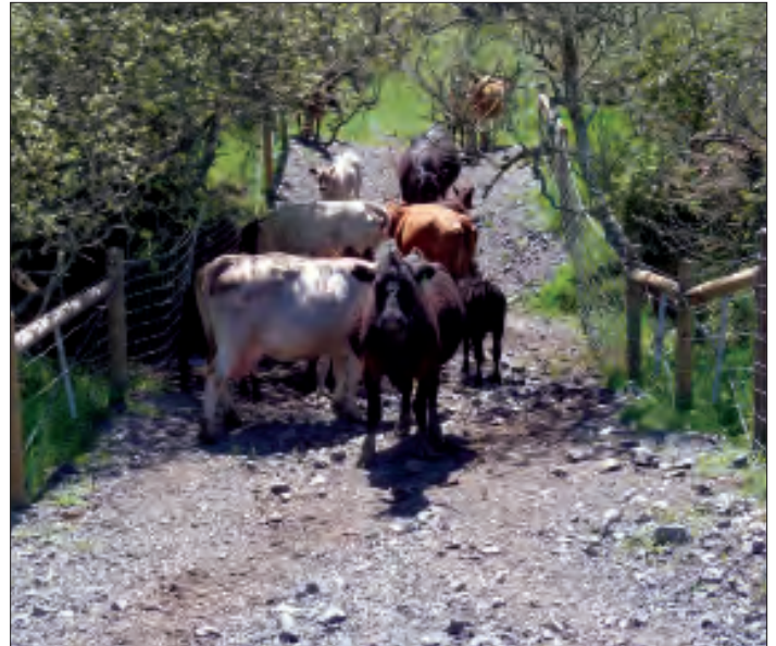
Paso de Ganado