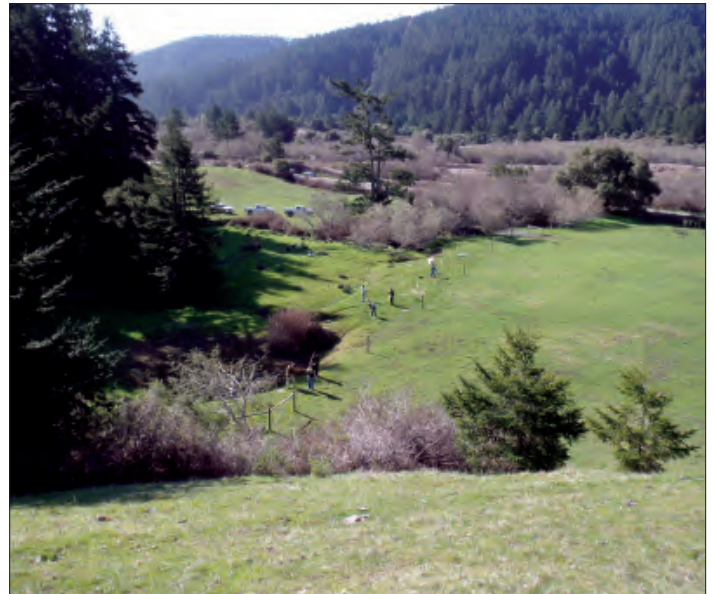
Cerca/ Mejoramiento del hábitat del riachuelo