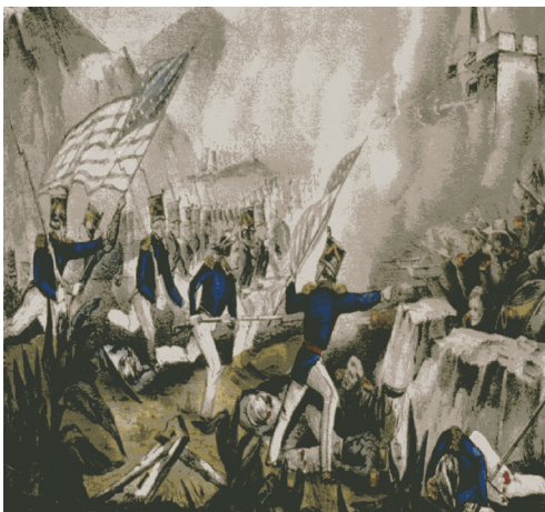
Una batalla en la Guerra Mexico-Estados Unidos

La guerra Mexicana-Estadounidense fue una vergüenza para México y literalmente un tesoro para los EE.UU. Dentro de pocos días, el puerto principal de México, Veracruz, fue bloqueado por la armada estadounidense. El ejército estadounidense luchó sobre tierra invadiendo a México entrando por California, Tejas, y eventualmente por Veracruz directo a la capital. Santa Anna, de nuevo ascendido a la presidencia, envió un tratado de paz a Washington a principios de 1847, pero sus términos no fueron aprobados. Más adelante ese año, con tropas estadounidenses en los alrededores de la ciudad de México, procedieron negociaciones de paz.