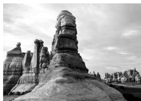
Chesler Park, The Needles

Desde la ruta nacional 191 tome Utah 211 oeste hacia las Needles. La ruta pavimentada continua adentro del parque. Las facilidades incluyen centro de visitante, rutas para vehículos de tracción a cuatro ruedas, guía propia y senderos primitivos, campamentos desarrollados, campamentos primitivos (en las zonas remotas se necesita permiso y el pago de una cuota), vistas panorámicas, programas de campamentos (depende de la temporada) y paseos comerciales desde los pueblos aledaños. Hay agua disponible todo el año. Se cobran cuotas por el ingreso al parque y por campamento. Abierto todo el año.