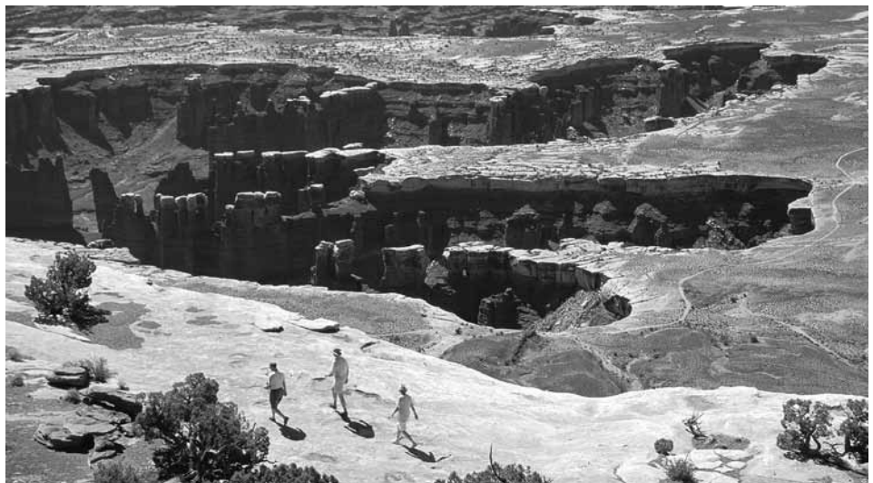
Grand View Point, Island in the Sky

Las cornisas rocosas que dirigen hacia abajo White Rim son el hábitat preferido de los borregos salvajes. Desde la isla mesa estos borregos parecen pintas tostadas del tamaño de una mosca; sólo los observadores más meticulosos los podrán ver. Desde los senderos de