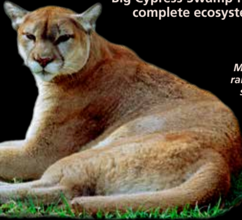
Male panthers range over 236 square miles.

The Preserve is the heart of the Florida panther's primary range. Each individual of this endangered species is a critical member of the population. With top predators like panthers and alligators surviving in the wild the Big Cypress Swamp forms a complete ecosystem.