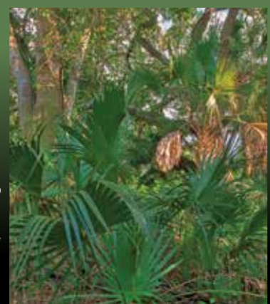
Hardwood hammocks. Hamacas de madera.

A diferencia de mar Everglades mayoría de hierba, Big Cypress tiene cinco hábitats que hacen que parezca, desde el aire, como un mosaico. Hábitats tienen suelos distintivos, las plantas y los animales, sobre la base de la elevación y la cantidad de agua superficial largas estancias en ellos. El agua conecta los hábitats a medida que fluye hacia el Golfo de México.