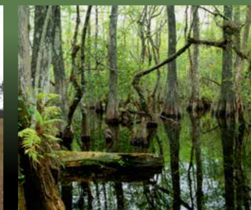
Cypress swamps. Pantanos de cipreses.