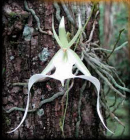
Big Cypress is a mosaic of prairies and tree islands (above). The ghost orchid (left) is one of over 30 native species in the region.