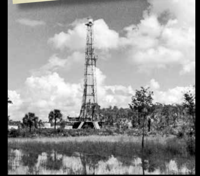
Top; middle: Hunters today; swamp buggy about 1950. Alta y media: Los cazadores de hoy; con swamp buggy, 1950. Bottom: Oil and gas exploration, begun in the 1940s, continues today. Abajo: Las casas privadas existen en la Reserva. More space for Spanish translation will be needed here.