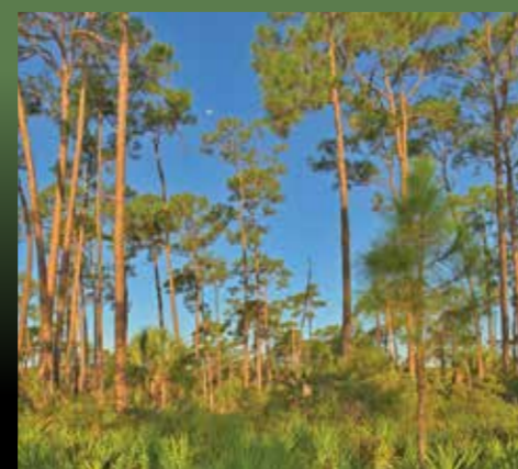
Pinelands. Bosques de pino.