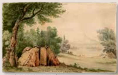
МОДЕЛЬ ИСКУССТВА СТАРМА / ПОЛ КЕЙН

Несмотря на болезни и конфликты, традиционные уклады сохранились по мере возможности, даже когда росли форт и деревня (крайний справа, сверху). Терраса продолжала служить перекрестком для встреч, и теперь уже местные жители смешивались с людьми из Гавайев, Европы, Канады и США. Некоторые приходили по собственному желанию, другие — нет.