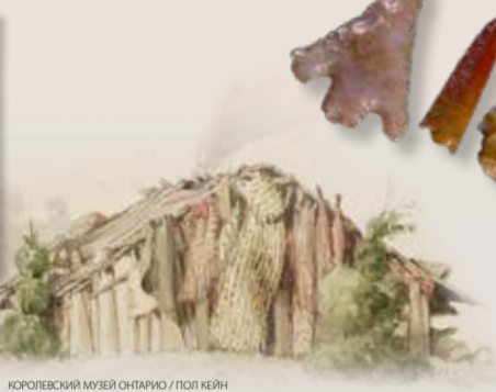
КОРОВОСКИЙ МУЗЕЙ ОНТАРИО / ПОЛ КЕЙН