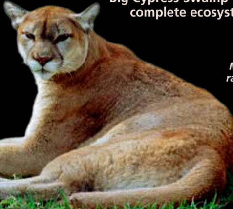
Male panthers range over 236 square miles.

The Preserve is the heart of the Florida panther's primary range. Each individual of this endangered species is a critical member of the population. With top predators like panthers and alligators surviving in the wild the Big Cypress Swamp forms a complete ecosystem.