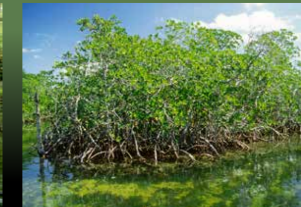
Estuaries. Los estuarios.