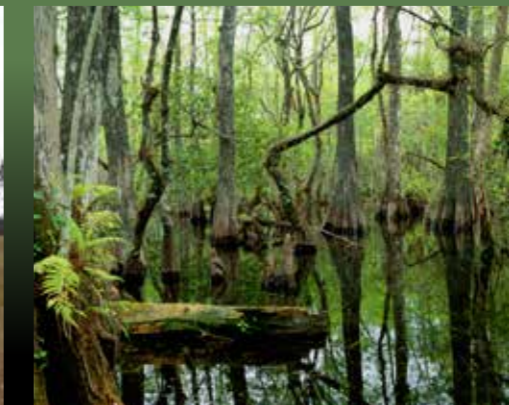
Cypress swamps. Pantanos de cipreses.