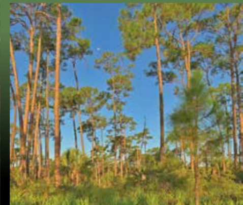
Pinelands. Bosques de pino.