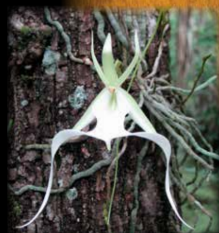
Big Cypress is a mosaic of prairies and tree islands (above). The ghost orchid (left) is one of over 30 native species in the region.

En la creación de la Reserva, el Congreso honra de las costumbres y la ocupación de los pueblos Miccosukee y Seminole. Aldeas existentes en la Reserva y que por generaciones.