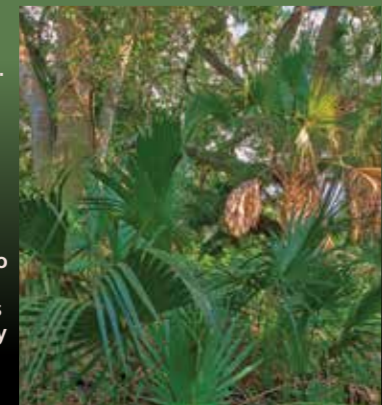
Hardwood hammocks. Hamacas de madera.

A diferencia de mar Everglades mayoría de hierba, Big Cypress tiene cinco hábitats que hacen que parezca, desde el aire, como un mosaico. Hábitats tienen suelos distintivos, las plantas y los animales, sobre la base de la elevación y la cantidad de agua superficial largas estancias en ellos. El agua conecta los hábitats a medida que fluye hacia el Golfo de México.