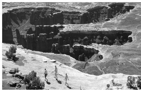
Grand View Point (大景观观景台)， Island in the Sky (空中岛屿)

从 US 191 公路转到 UT 313 公路，然后向南行驶至 Island in the Sky (空中岛屿)。整个台地都有铺砌的道路贯穿其中。设施：游客中心、四驱车道路、自助游及原始步道、已开发的营地、原始营地 (需许可证)、野餐区域、观景台、道路和步道旁展览、护林员访谈和节目 (分季节) 以及附近城镇的商业游。Island in the Sky Visitor Center (空中岛屿游客中心) 从三月到十月供应水；收取门票费和露营费。全年开放。