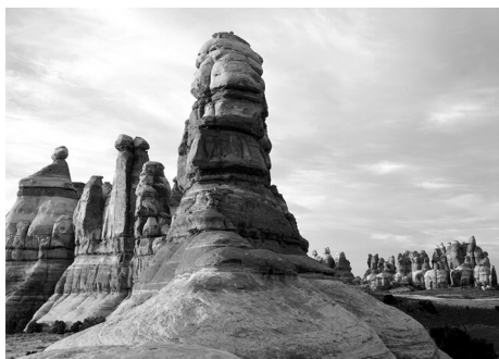
Chesler Park (切斯勒草甸)，Needles (针锋)

Needles (针锋) 各种对比鲜明的名称体现了这一地貌的多样性：Devils Kitchen (魔鬼厨房)、Angel Arch (天使拱门)、Elephant Hill (象山) 以及 Paul Bunyans Potty (保罗布尼安的便盆)。犹如雕刻而成的尖顶岩、拱门岩、峡谷、地堑和锅穴让人惊叹不已。然而，占据主流的还是红色和白色的尖顶岩群—Needles (针锋)。地壳运动导致岩石断裂；在流水和冻融的侵蚀作用下，逐渐形成了如今杂乱无章的地形地貌。